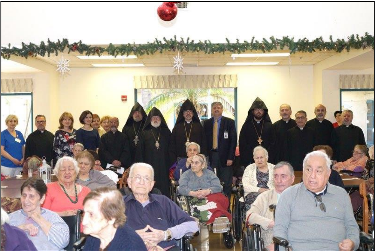
Միշըն Հիլզի համալիրին մէջ:

29 դեկտեմբերին, հանդիսապետութեամբ թեմի առաջնորդ Մուշեղ արք. Մարտիրոսեանի, ամանորի եւ Ս. Ծննդեան տօնին նուիրուած արարողութիւններ տեղի ունեցան «Արարատ տան»